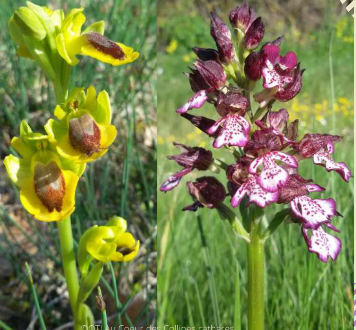
Au Coeur des Collines cathares